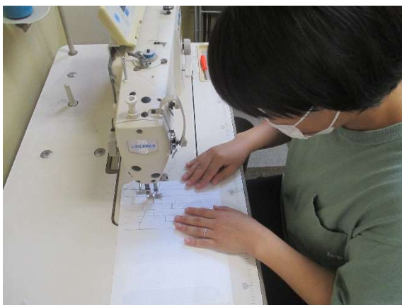
エコバッグ制作のための縫製指導