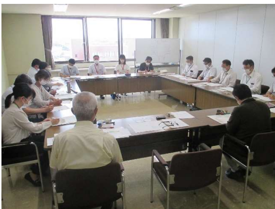
出雲圏域農福連携推進協議会