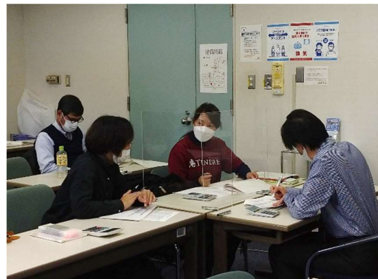
事例から学ぶ工賃向上セミナー グループワークの様子