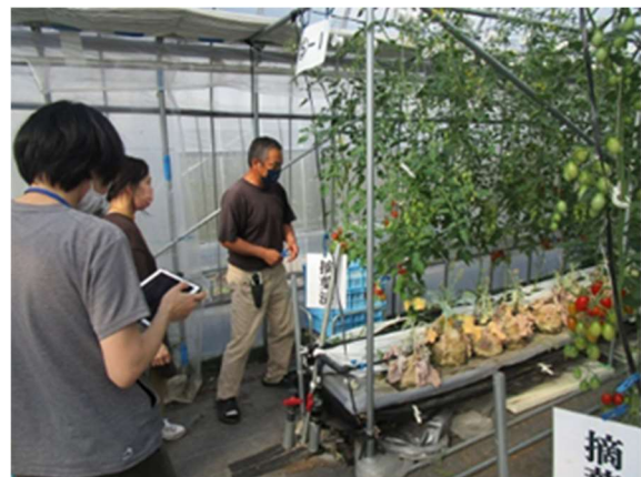
ミニトマト作業前説明