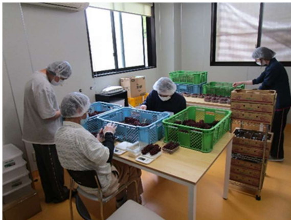
デラウェア出荷調整（パック詰め）