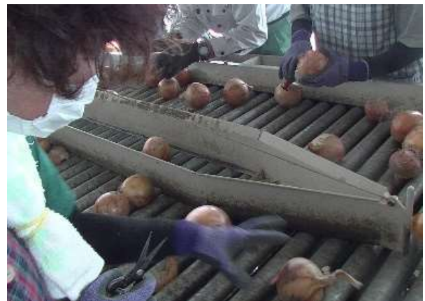
J A しまね斐川玉葱広域調製施設