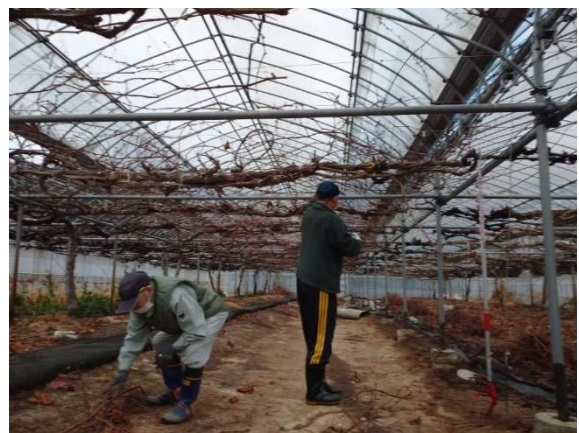
ぶどう剪定枝片付け