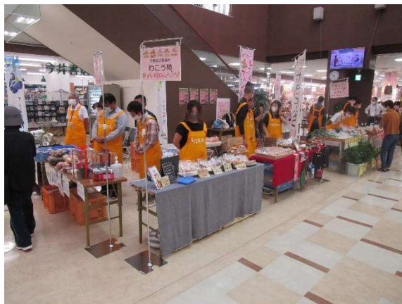
しふく&農福マルシェ in 安来プラーナ