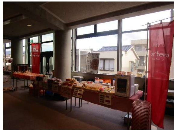
しふくのマルシェ in しまね県民福祉大会