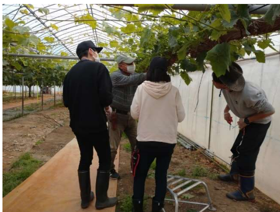
施設外就労でシャインマスカット花穂整形に取り組む事業所へのサポーターによる現地指導