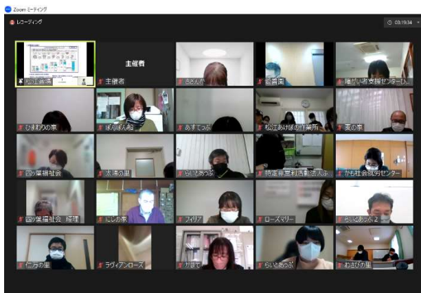
インボイス制度対策セミナー オンライン視聴の様子