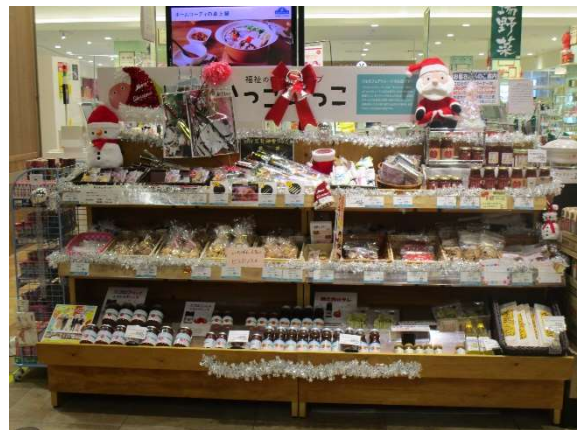
クリスマスディスプレイ