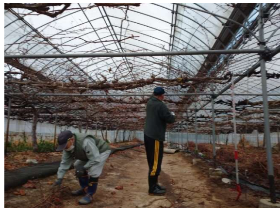
ぶどう剪定枝片付け