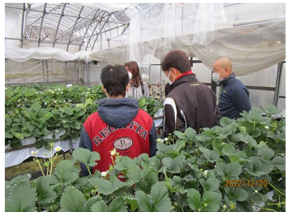
イチゴ作業打ち合わせ