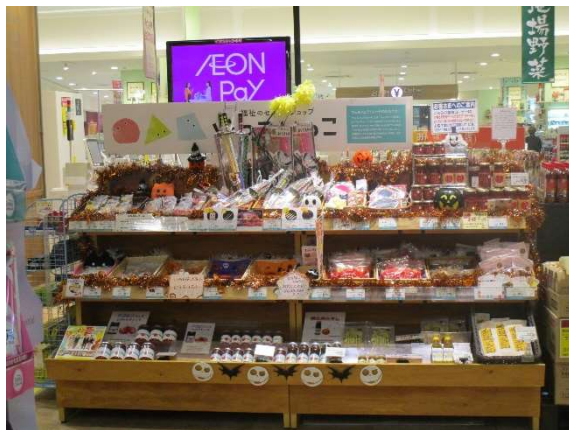
ハロウィンディスプレイ